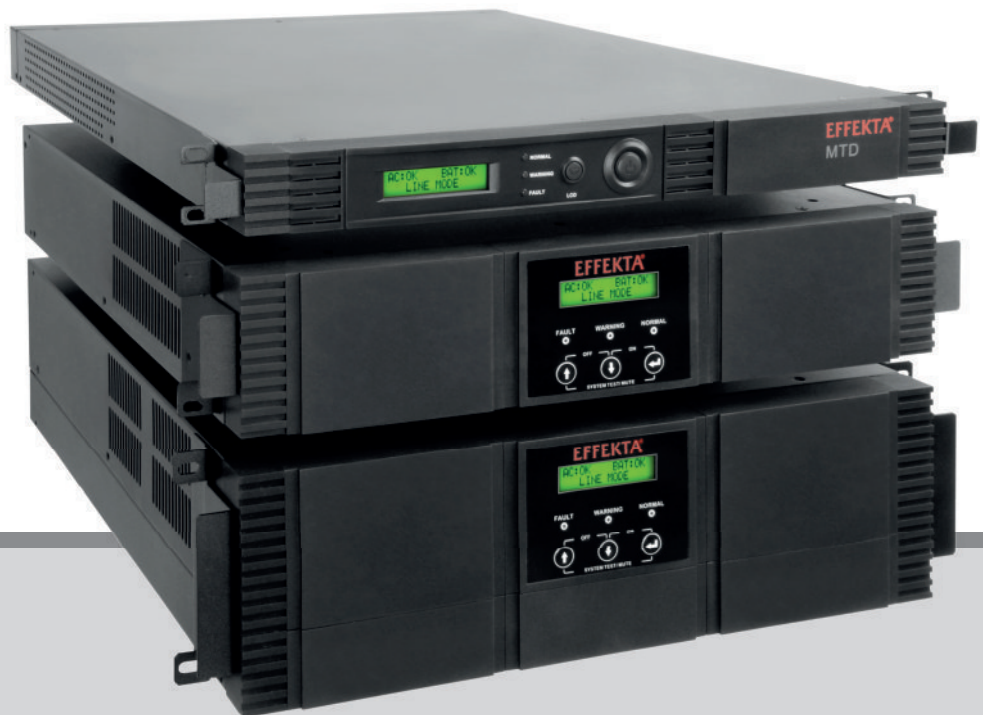
Bild rechts Oben: MTD 700/1000/1500 RM Mitte: MTD 2000 M Unten: MTD 3000 RM

Line-Interactive USV 700, 1000, 1500, 2000, 3000 VA 19" Rackmountable