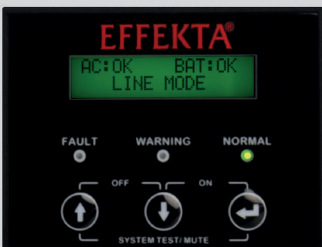
Bild links: Übersichtliches Bedienpanel mit hintergrundbeleuchtetem LCD Display (2000/3000 VA-Modell)

Option: XL-Version mit Möglichkeit zur einfachen Erweiterung der Autonomiezeit durch externe Batteriepacks